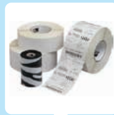
Consumables (labels, ribbons, PVC cards)