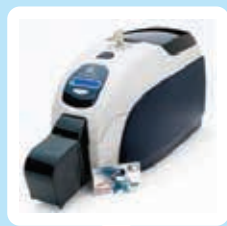
PVC card printers